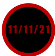
Wygląd znacznika do znakowania opon