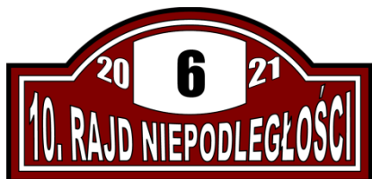
Tablica Rajdowa na masce

Wygląd tablicy rajdowej i numerów bocznych zawierających reklamę dodatkową: